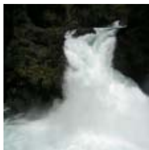
Cascada Los Alerces

Otra excursión lacustre tiene como destino Puerto Blest, Cascada Los Cántaros y lago Frías. El viaje se inicia en Puerto Pañuelo. La embarcación navega el brazo Blest del lago Nahuel Huapi, pasa por la isla Centinela donde descansan los restos del Perito Francisco P. Moreno y se interna en el profundo fiordo del lago en cuyas costas y desde el barco es po-