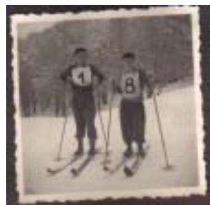
Escuela de Esquí "Tronador"