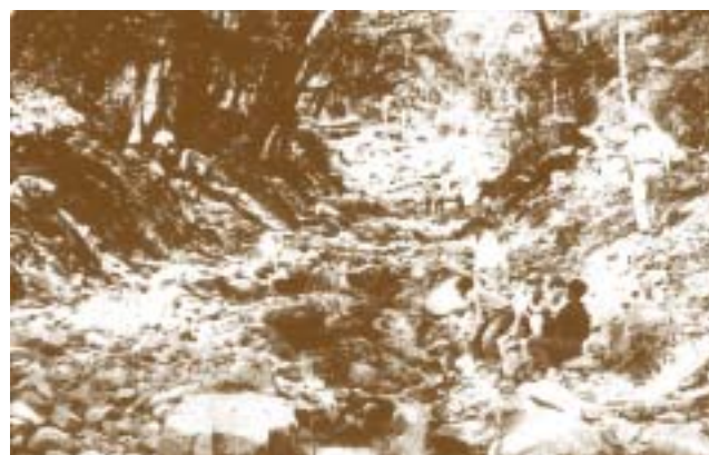
Arroyo "La Escalera", hace 40 años.