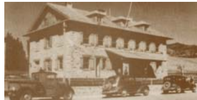
Intendencia Parque Nacional Nahuel Huapi

Con respecto a la nueva arquitectura de Parques creo que