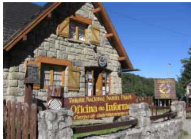
Seccional Villa La Angostura