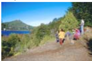
Vecinos en la laguna El Trébol

El trabajo llevado en conjunto con la Junta Vecinal El Trébol permitió el 15/2/2005 declarar por ordenanza Municipal una nueva reserva natural urbana y poner en práctica una experiencia piloto sobre cómo elaborar planes de acción a nivel comunitario, tendientes a mejorar la protección de los ambientes de la ciudad con el fuerte compromiso en la gestión de sus habitantes.