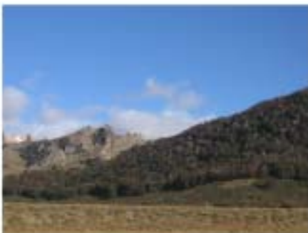
Bosque de transición. Valle del río Rihuhau