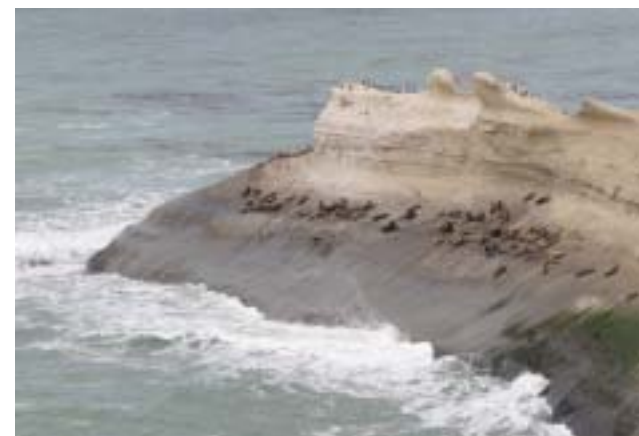
Costa litoral atlántica

Monte León fue el asentamiento de pueblos originarios cazadores-recolectores, desde por lo menos 3.000 años