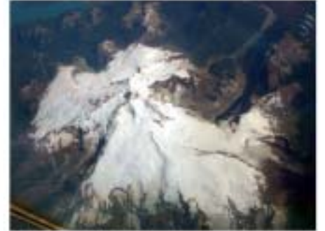
Añoandino. Monte Tronador.