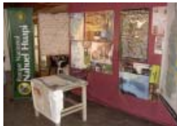
Stand de Parques Nacionales

tar sobre el bosque nativo. Presentaciones en video, canciones, exposición de plantas nativas formaron parte de las actividades que se desarrollaron en esta jornada.