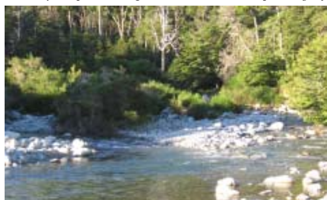
Desembocadura arroyo Ragintuco

para el desarrollo económico de San Carlos de Bariloche y de la región. La vegetación de las riberas ocupa franjas estrechas y generalmente son las más impactadas debido a que la mayor parte de las actividades realizadas por el hombre tienen que ver con el agua o el acceso a la misma. Para acceder a las costas se dan recomendaciones básicas como pisar siempre suelos duros o arena, no atravesar vegetación acuática a pie ni con una embarcación. En los ríos evitar caminar por el lecho para no dañar las camas de desove. Y por último no arrojar elementos sólidos o líquidos, ni lavar la vajilla en el agua. ■