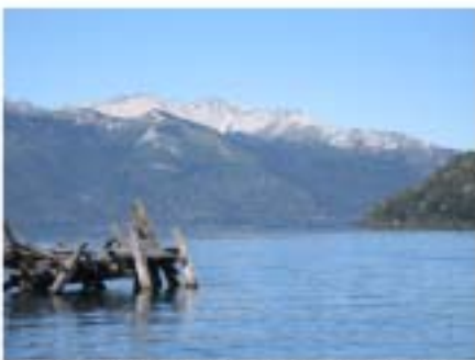
Lago Nahuel Huapi. Muelle viejo Quetrihué