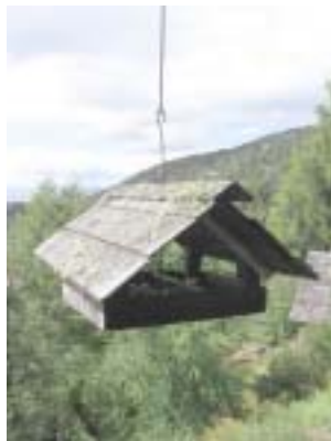
Desde el refugio Berghof

En el verano organizaron salidas para recorrer y explorar las montañas.