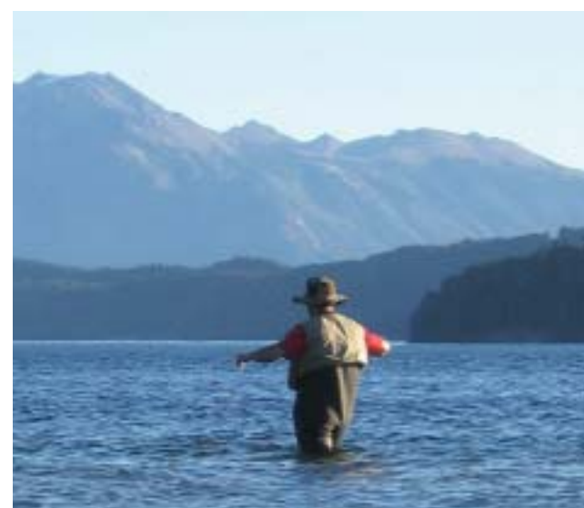
Pesca con mosca en el lago Nahuel Huapi

Al establecer épocas de veda o prohibición de pesca en algunos ambientes los criterios a tener en cuenta son no sólo la protección del recurso pesquero, sino también aquellos relacionados con la conservación del am-