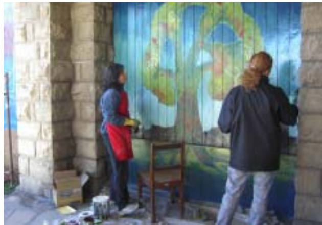
Los "muraleros" en plena actividad

nes de pintores argentinos como García Urriburu, Berni y Carpani. Los Murales significan para este grupo un medio para llegar a todo tipo de público. Se trata de acercar Arte