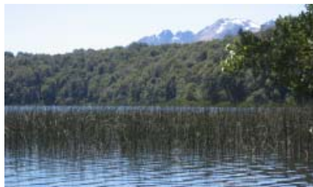
Laguna Patagua en el P. N. Los Arrayanes

El conjunto paisajístico-natural califica como atractivo turístico con el Nivel I (el nivel más alto de la UNESCO) dado que por sí solo puede convocar al turismo internacional y nacional. Anualmente el bosque de arrayanes recibe un promedio de 300.000 visitantes, que son una muestra de la importancia que reviste el destino. ■