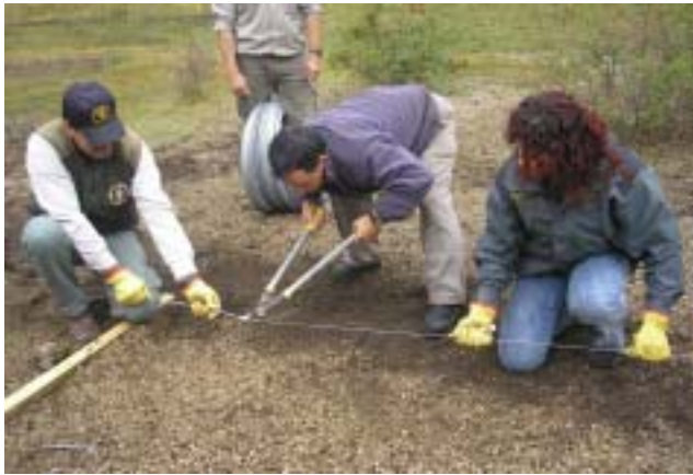
Personal del Parque instalando el alambrado

Las lagunas temporarias y mallines fueron considerados durante mucho tiempo por la socie-