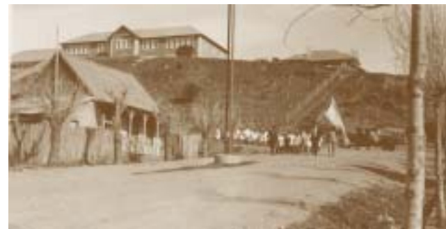
Escuela N° 16, Francisco P. Moreno

Sí totalmente, el grupo de arquitectura trabajó con una ca-