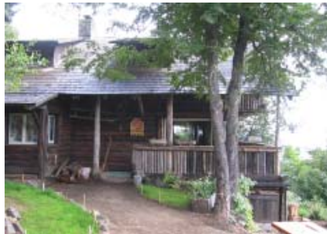
Entrada al refugio Berghof