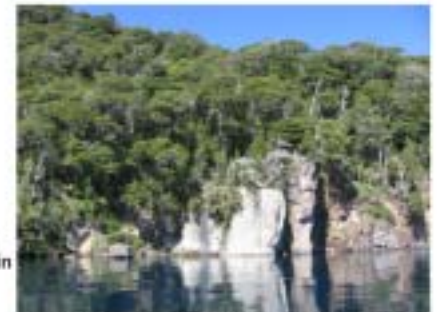
Bosque húmedo. Península de Quetrihué