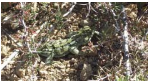
Matuasto en el Cerro Carbón, 1.600 m.s.n.m.

"Fauna del Parque Nacional Nahuel Huapi". C. Chehébar y E. Ramilo, Dra. N. Ibargüengoytia (Univ. Nac. del Comahue).