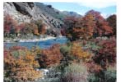
Río Ñinhuau. Bosque de Transición.