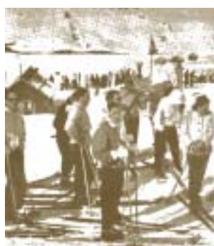
Alumnos en escuela de esquí