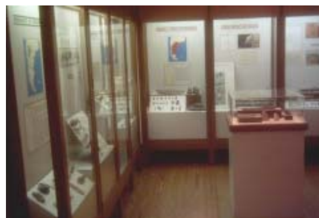
Sala de arqueología

Participaron de dichos Talleres: la Sociedad Naturalista