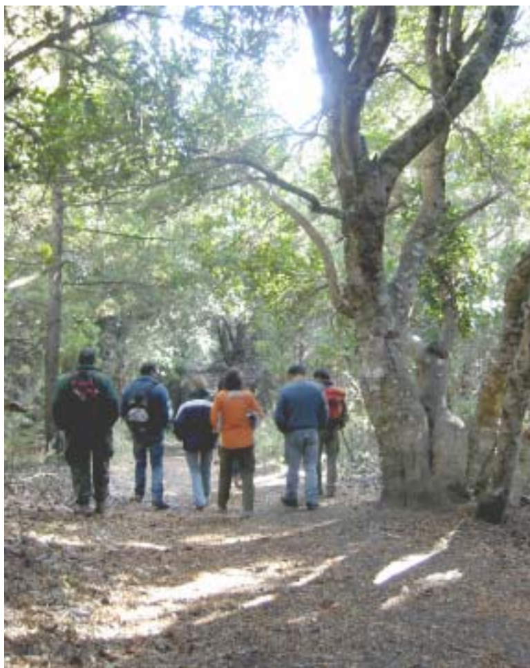
Sendero en Villa Traful