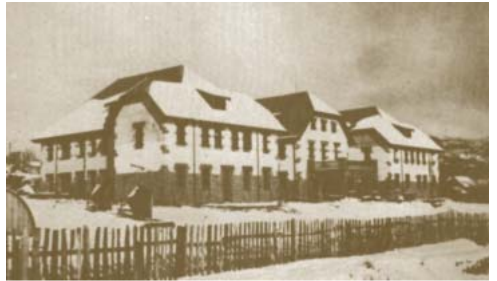
Foto antigua del Hospital de S.C. de Bariloche

Es en este contexto que Parques Nacionales cede el terreno de una manzana completa para la construcción del Hospital, considerando que era imprescin-