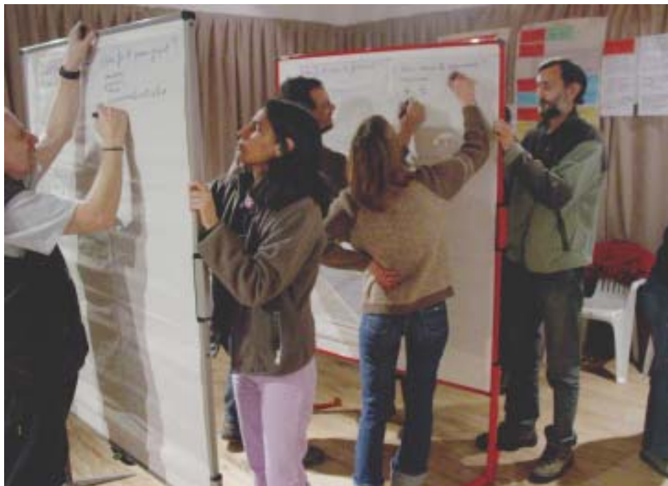
Participantes del Taller "Construyendo una visión compartida"

El personal del Museo y la Red de Facilitadores de Bariloche, desarrollan un proyecto participativo para una nueva visión en relación a la conservación del patrimonio cultural y natural de la región.