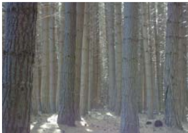
Forestación en Isla Victoria

El rápido crecimiento de las especies exóticas y su tolerancia a situaciones ambientales adversas representa un riesgo para la conservación de nuestros bosques nativos.