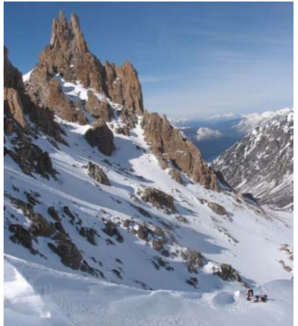
Esquí de travesía

• REGISTRARSE: Dentro de la jurisdicción del Parque Nacional Nahuel Huapi, existe