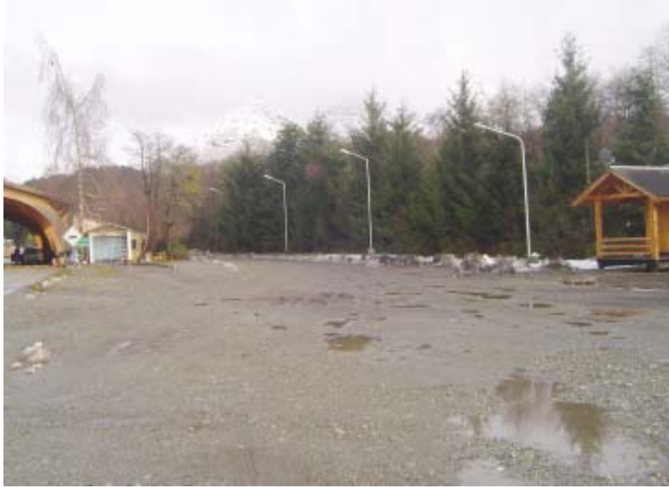
Acceso a la aduana Argentino-Chilena

Con el objeto de facilitar a los visitantes el tránsito entre Argentina y Chile, la Aduana argentina proyecta la materialización de una rama independiente de salida y entrada directa entre estos paí-