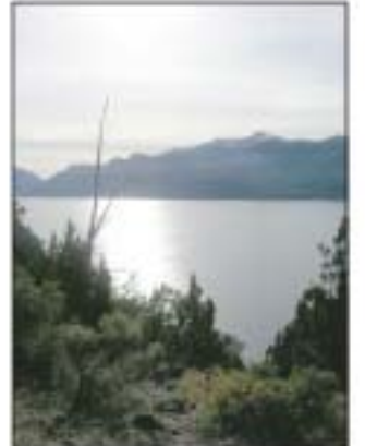
Lago Traful. Bosque Húmedo.