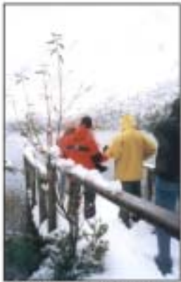
Sendero a Los cantaros. Selva Valdiviana