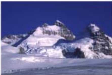
Monte Tronador. Ambiente Altoandino.