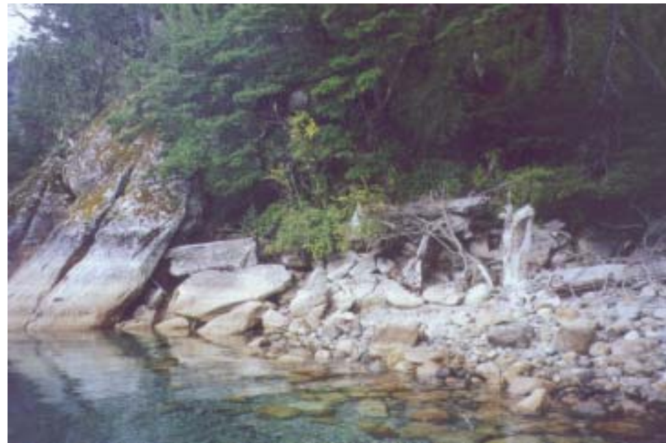
Habitat del Huillín en Puerto Blest