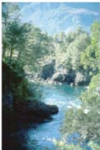
Río Manso. Bosque Húmedo.