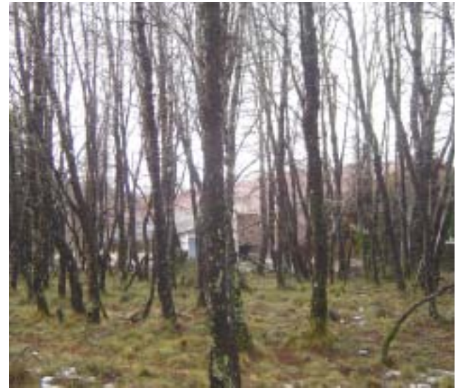
Bosque en cercanías de la aduana

Se estima que las obras darán comienzo en la primavera del presente año y tendrán una duración aproximada de tres meses.