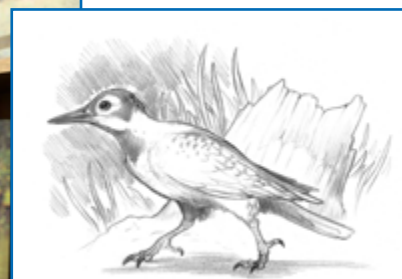
Colaptes naroskyi o "Pájaro Carpintero de Tito"

Fuentes consultadas: www.avesargentinas.org.ar