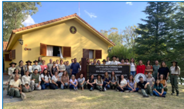
Educadores/as ambientales de todas las áreas protegidas del país

Taller: Herramientas y estrategias para la Educación Ambiental en la Administración de Parques Nacionales (APN).