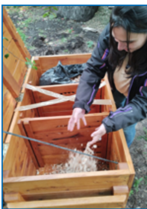
Incorporación de aserrín