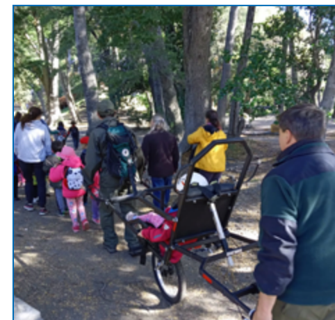
Recorrida que incluyó el uso de la "champa bike"