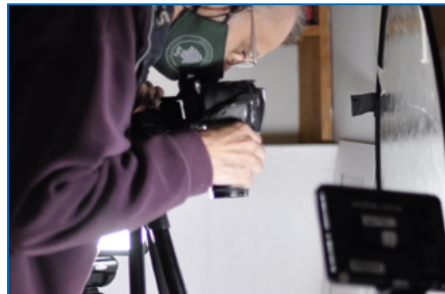
Set de fotografía montado para el registro fotográfico