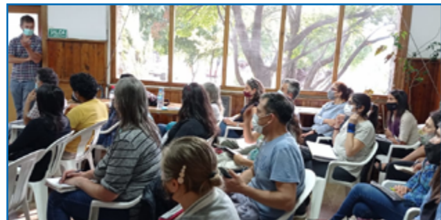
Clase presencial del Trayecto Fundamentos de la Educación Ambiental

Con la mirada puesta en brindar a la comunidad regional un espacio de capacitación e intercambio de saberes en Educación Ambiental (EA), el Centro Regional Universitario Bariloche (CRUB), dependiente de la Universidad Nacional del Comahue, y el Parque Nacional Nahuel Huapi (PNNH), hicieron alianza para llevar adelante esta formación que comenzó en marzo de 2022.