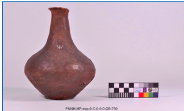
Vasija de cerámica de la colección Artayeta