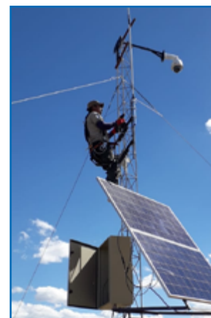
Repetidora analógica-digital junto a un domo de video