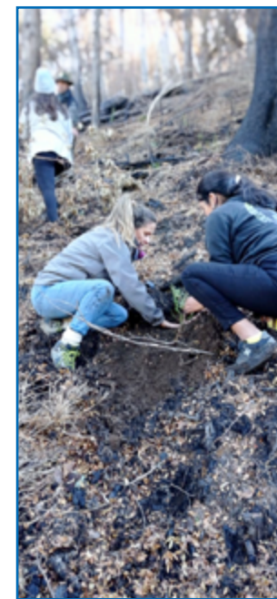
Más de 2000 árboles y arbustos fueron plantados en la zona del incendio