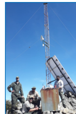
Antena repetidora para la zona de Villarino