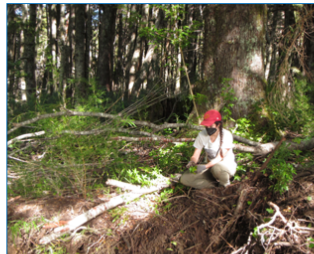
Voluntaria trabajando en el control manual de focos de hiedra

El control del material guardado en bolsas reveló que parte del material extraído había elongado los tallos, peciolo y hojas. Sin embargo, todos ellos se encontraban etiolados (de color blanco) indicando que habían crecido en base a reservas, y no por haber accedido a luz para realizar fotosíntesis, luego de dos años de depositado en las bolsas. Consideramos entonces que la metodología de disposición de residuos propuesta es efectiva. Sin embargo, nos ha sorprendido la ocurrencia