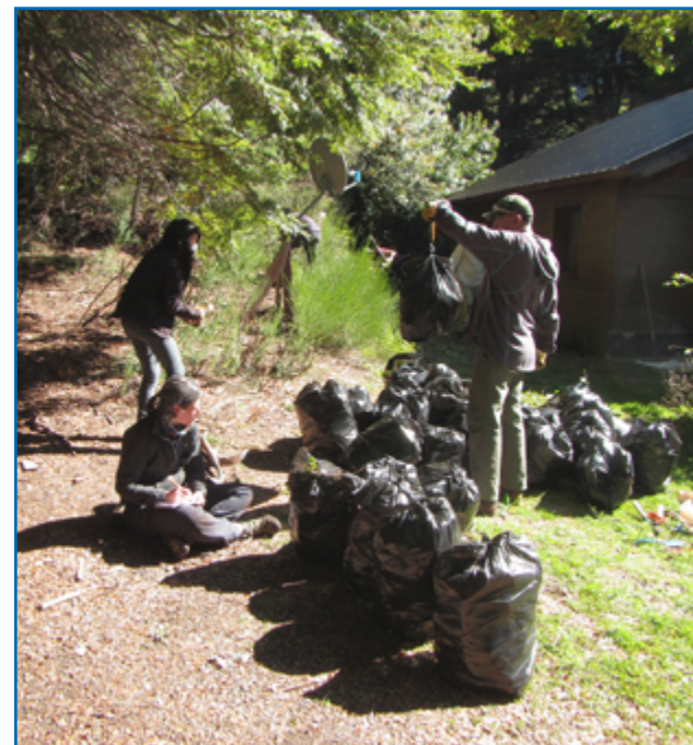
El material removido fue colocado en bolsas de consorcio negras, que fueron pesadas