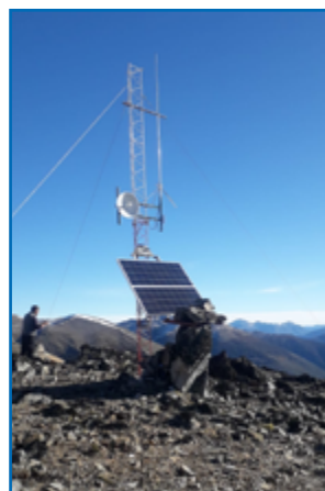
Colocación de repetidora sobre cerro Meta

La incorporación de estas nuevas tecnologías permite crear avances sin precedentes en la Administración de Parques Nacionales, que son de gran importancia para las comunicaciones, emergencias, uso público e investigaciones, en un territorio cuya característica topográfica y gran extensión hace necesaria que se busquen alternativas que permitan contar con herramientas que faciliten la gestión. ■