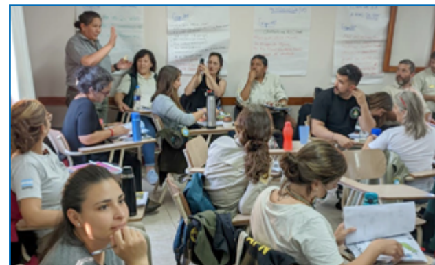
Compartiendo saberes en el Centro de Capacitación de Embalse, Córdoba

El encuentro fue organizado por el Programa de Educación ambiental y por la Dirección de Capacitación de la Administración de Parques Nacionales. Fue muy valioso la puesta en común de experiencias entre las y los educadores ambientales