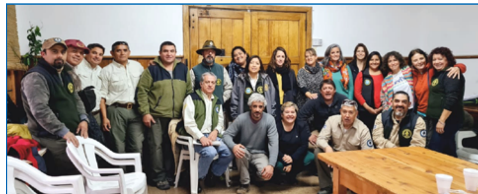
Agentes del área protegida que participaron de la capacitación

Para lograr nuestro objetivo el taller comenzó abordando los conceptos básicos, no sólo en su definición específica, si no en su aplicación directa y real. La percepción del riesgo como herramienta fundamental para lograr la sensibilización necesaria y su incorporación en los procesos de gestión. Definidos así los parámetros y el marco de trabajo, mediante la aplicación de la fórmula “Riesgo = Amenaza X Vulnerabilidad”, se continuó con la aplicación del Ciclo de Gestión del Riesgo y sus etapas: Reducción del Riesgo de Desastres (prevención, mitigación y preparación), Manejo de Crisis (alerta y respuesta) y Recuperación (rehabilitación y reconstrucción). Entendiéndolos no como compartimentos estancos, sino como partes de un proceso dinámico e interrelacionado. De esta manera, podemos definir y articular mejor las distintas instancias de participación, lo que permite lograr un mejor ordenamiento y planificación de las distintas etapas. En concordancia con lo visto, el taller se focalizó en las tareas de elaboración, desarrollo, aplicación, ejecución y evaluación de los distintos planes (Planes de Emergencias, Planes de Contingencias y Protocolos).