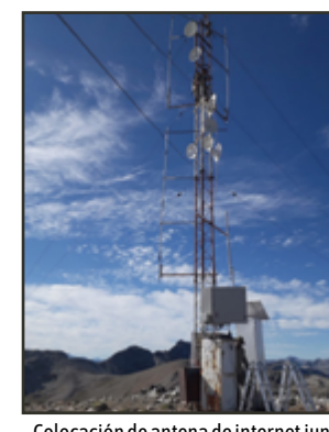
Colocación de antena de internet junto a un domo de video