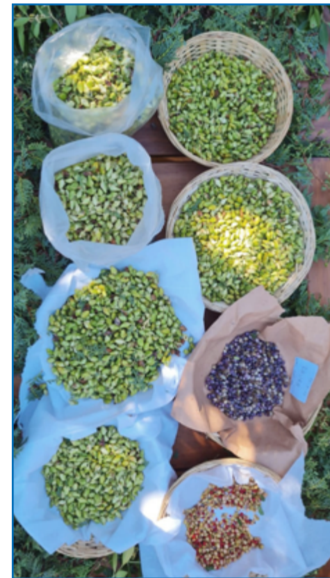
Semillas de radial, ciprés, notro, coihue y maitén