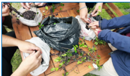
Manos que colaboran, que trabajan y clasifican semillas de especies nativas que servirán para futuras plantaciones en áreas afectadas por el fuego u otro impacto ambiental