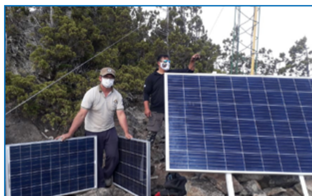
Paneles solares que proveen energía a la repetidora