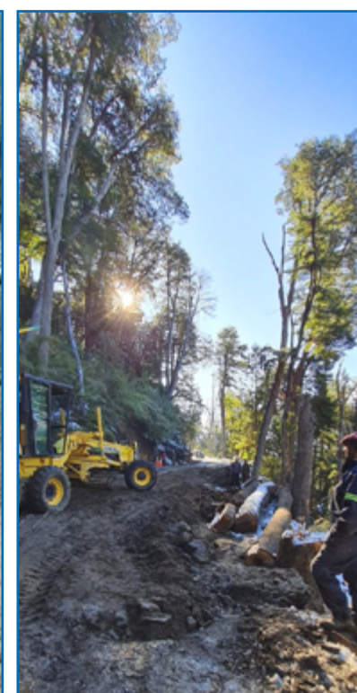
Armando manual de 14 gaviones y reparación con maquinaria