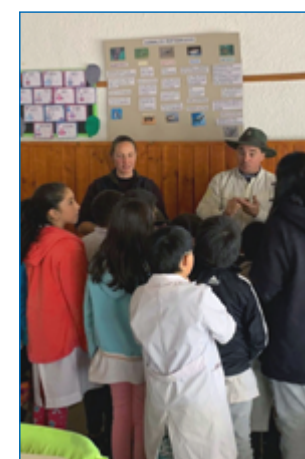
Niños y niñas dialogando con Guardaparques

Para finalizar la visita, los y las alumnas realizaron preguntas sobre el trabajo de las y los guardaparques y junto a las docentes diseñaron folletos en los que se abordaron los temas tratados. ■