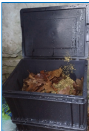
Compostera de tipo modular