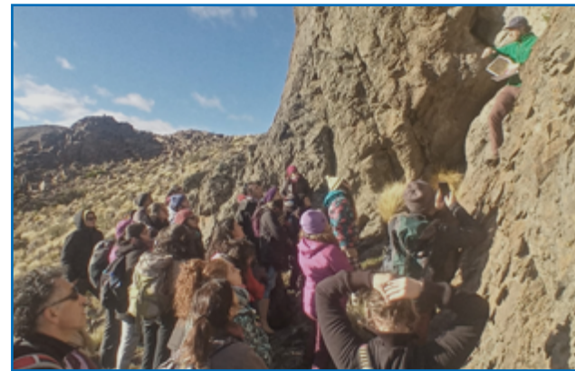
Salida de campo con estudiantes de la Diplomatura

Desde esa diversidad de lugares de procedencia, profesiones y experiencias se formó un grupo de estudiantes y docentes que, a medida que avanza el tránsito de los trayectos, va profundizando en los intercambios y en las reflexiones. Las conversaciones compartidas siempre tienen la intención de conectar con cómo estamos siendo cada una y cada uno de nosotros en nuestra vida, para que a partir de esa autoconciencia se pueda ir vislumbrando cómo y desde dónde accionar los cambios posibles. Repensar nuestra interrelación con el ambiente no configura sólo una vinculación entre personas y naturaleza, sino también incluir