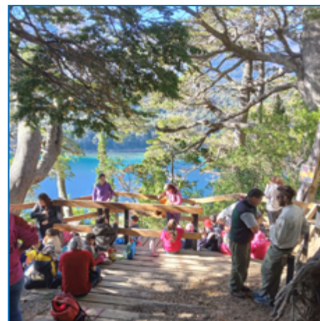
Conociendo la flora local