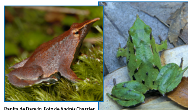
Ranita de Darwin.

Aparentemente las poblaciones no son tan numerosas actualmente como lo fueron en el pasado. Es catalogada como en peligro de extinción por la lista roja de especies amenazadas de la Unión Internacional para la Conservación de la Naturaleza (UICN) y es una especie amenazada según SAYDS, 2013 (Secretaría de Ambiente y Desarrollo Sustentable). Por ello y teniendo en cuenta su escasa presencia a nivel poblacional dentro del sistema nacional de Áreas Protegidas y la ausencia