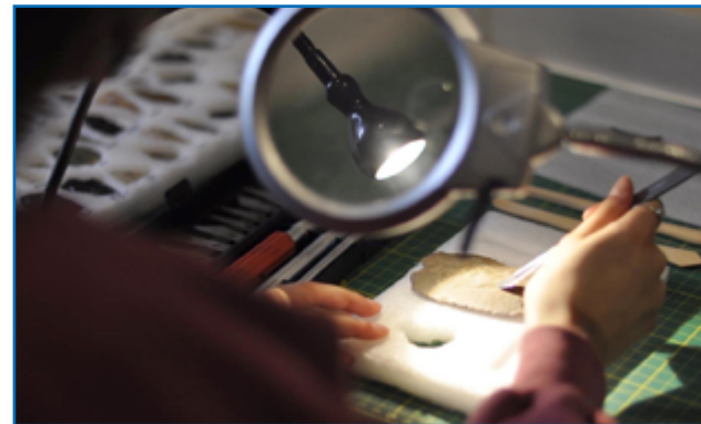
Tratamiento preventivo de una pieza museológica

La puesta en marcha de este proyecto es para el Museo de la Patagonia y el Parque Nacional Nahuel Huapi una gran oportunidad, que amplía las redes de vinculación con los ámbitos de investigación, permite continuar innovando y apostando a seguir siendo un espacio cultural representativo de la diversidad cultural y natural de la región. Sus avances resultarán en la mejora de la conservación de las piezas arqueológicas del Museo y